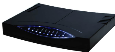
Checktel hardware: kunststof behuizing: lxbxh: 20x15x4 cm